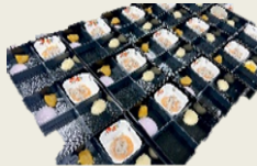
←おせち料理を盛り付けている写真